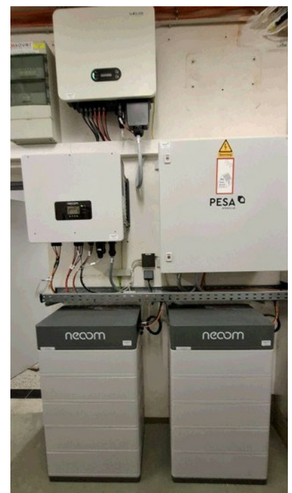
Bild: Stromspeicher in der MS Hofkirchen

Darüber hinaus ist die Gemeinde auch Mitglied in der Energiegemeinschaft Ranna von neom. Der Gesamtstromverbrauch aller Gemeindegebäude im letzten Jahr betrug ca. 314.000 kWh, wobei ca. 60.000 kWh in der Energiegemeinschaft Ranna angefallen sind.